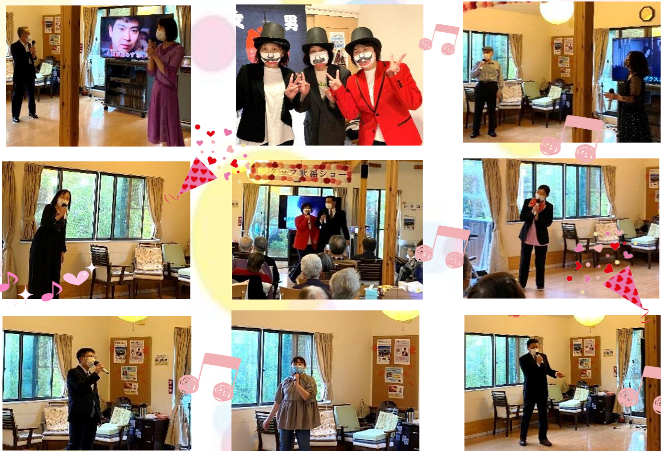
スタッフ歌謡ショーを開催しました。スタッフそして会長や唐しじみさんにも参加して頂きました。デュエットや髭ダンスのショーなど盛りだくさんでご利用者様にも楽しんで頂きました。