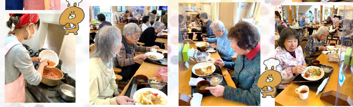
今回和楽初のセンター長の手作りカレーライスを提供させて頂きました。朝からじっくりカレーを煮込んで、サラダとスープ付きの美味しいカレーライスが完成しました。皆様から美味しいと大好評でした。6月はハヤシライスを予定しておりますので、お楽しみにして下さい♪